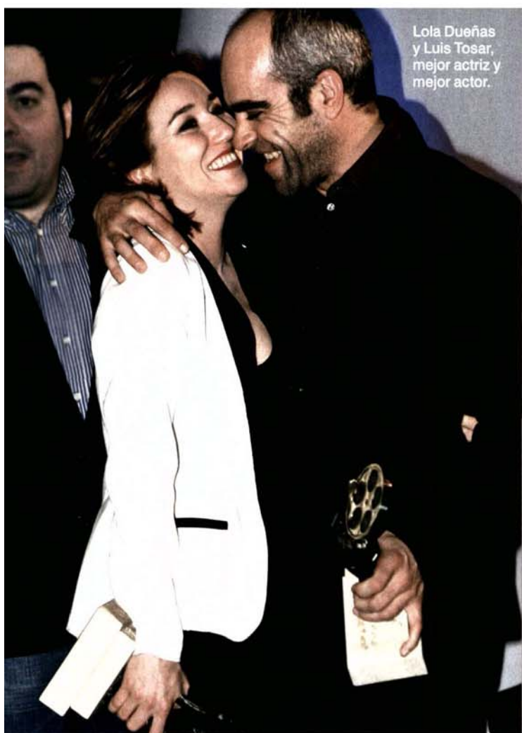
Lola Dueñas y Luis Tosar, mejor actriz y mejor actor.