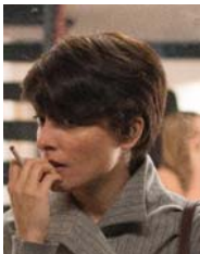
BÁRBARA LENNIE por MARIA (Y LOS DEMÁS)