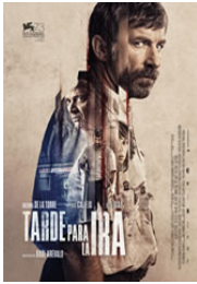
TARDE PARA LA IRA Dirección: Raúl Arévalo