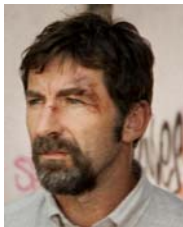
ANTONIO DE LA TORRE