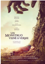
UN MONSTRUO VIENE A VERME Dirección: Juan Antonio Bayona