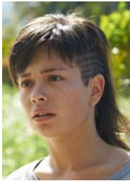
ANNA CASTILLO por EL OLIVO