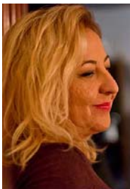
CARMEN MACHI por LA PUERTA ABIERTA